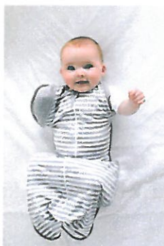
Zdj. 2 – ETAP2

Opinia nr Op-5259/2020 (Zdj. 3 i 4) Otulacz przejściowy Transition Bag ETAP 2,