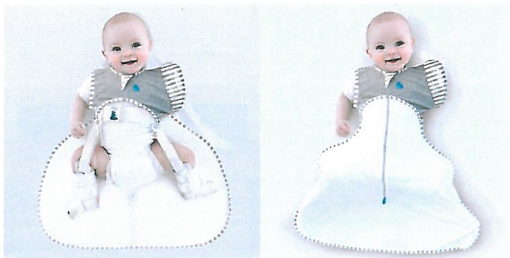
Zdj. 7 i 8.

Łatwy w utrzymaniu: można prać w pralce i suszyć w suszarce bębnowej