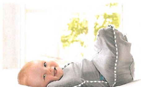
Zdj. 1 – ETAP1