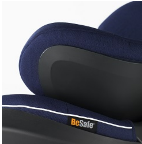
Pokrętko do regulacji zagłówka