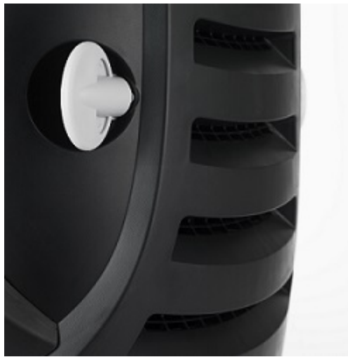
Rączka do odchylenia oparcia