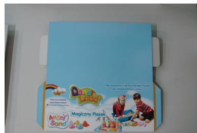
dolna plansza z półką