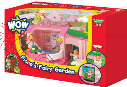
Category F Kategoria F