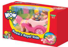
Category C Kategoria C