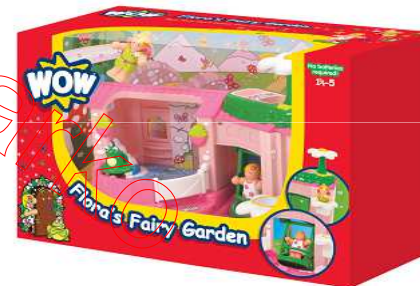
Category F Kategoria F