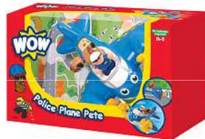
Category D Kategoria D