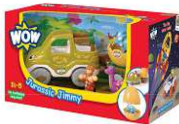
Category E Kategoria E