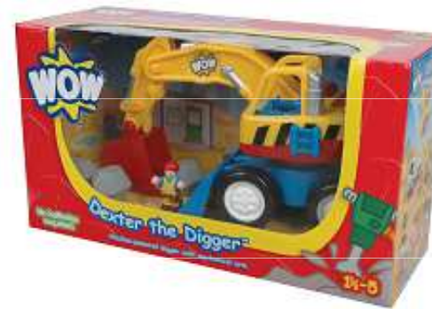
Category G Kategoria G