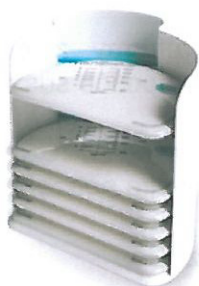
Rys.7. Organizery z płaskimi torebkami