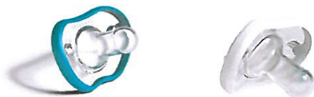
Rys. 5 Smoczki do uspokajania