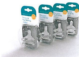
Rys 2. Smoczki do butelki

Steryliczator (Rys. 3) pozwala sterylizować smoczki i butelki w kuchence mikrofalowej i przechowywać sterylne - eliminuje 99,9% bakterii w ciągu czterech minut, a przy zamkniętej pokrywie jego zawartość pozostaje sterylna przez 24 godziny. Dzięki temu można sterylizować butelki przed snem i budzić się rano mając butelki wysterylizowane i gotowe do użycia. To rozwiązanie pozwala zaoszczędzić czas i energię.