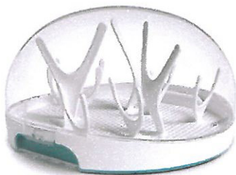
Rys. 3. Sterylizator