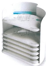
Rys.7. Organizery z płaskimi torebkami