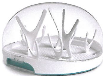
Rys. 3. Sterylizator