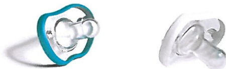
Rys. 5 Smoczki do uspokajania