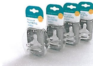
Rys 2. Smoczki do butelki

Sterylizator (Rys. 3) pozwala sterylizować smoczki i butelki w kuchence mikrofalowej i przechowywać sterylne - eliminuje 99,9% bakterii w ciągu czterech minut, a przy zamkniętej pokrywie jego zawartość pozostaje sterylna przez 24 godziny. Dzięki temu można sterylizować butelki przed snem i budzić się rano mając butelki wysterylizowane i gotowe do użycia. To rozwiązanie pozwala zaoszczędzić czas i energię.